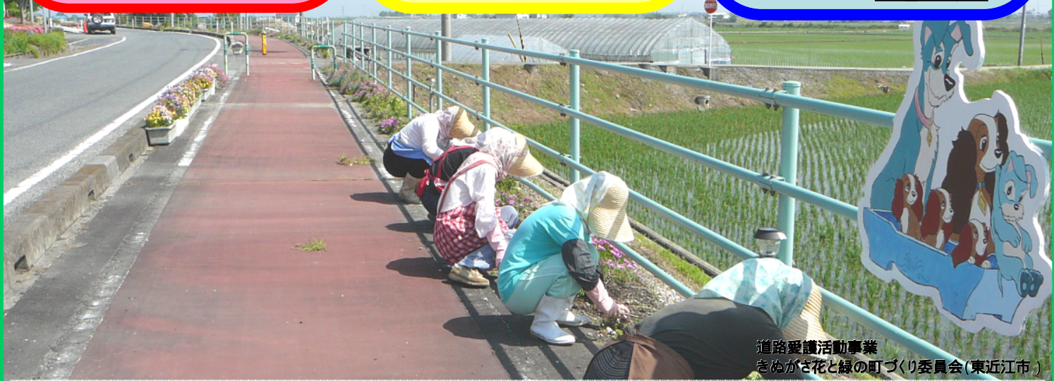
道路愛護活動事業 きぬがさ花と緑の町づくり委員会(東近江市)